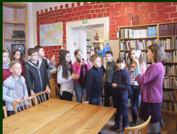
Gyermekkönyvek Világnapján a Bod Péter Megyei Könyvtárban