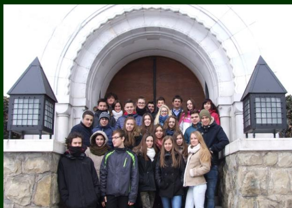
Látogatás a Székely Nemzeti Múzeumban