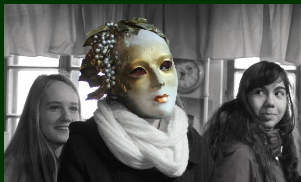
Magyar Kultúra Napja a Tamási Áron Színházban