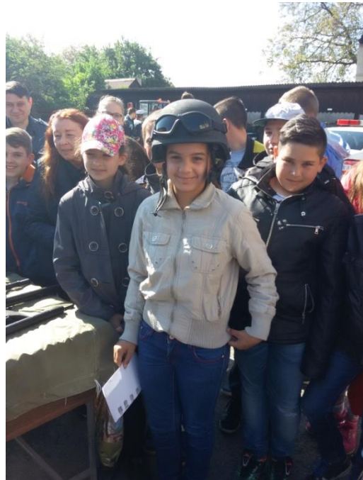
Ghelița, la 14 iunie 2017