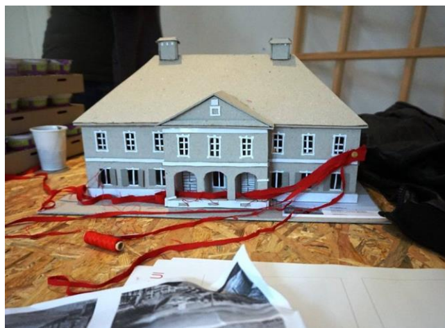
Arhitectură Experimentală- Instalație