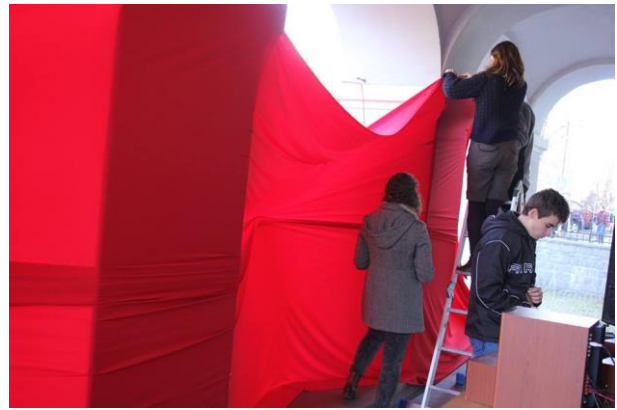
Arhitectură experimentală- Macro Instalție