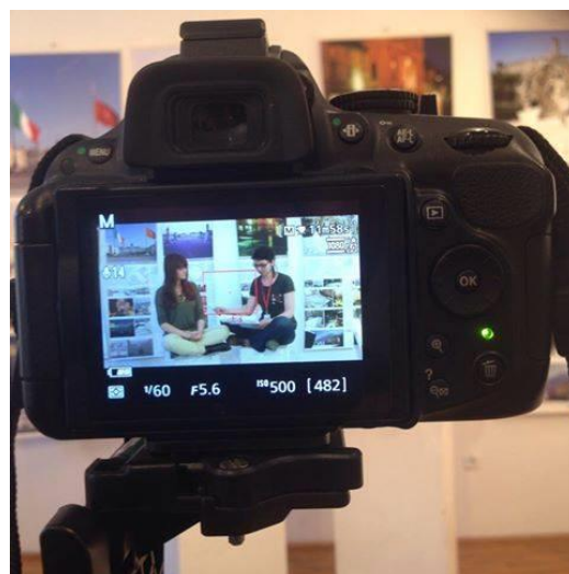
Grupa de presă